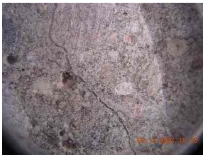
Verfüllungsgrad der Risse