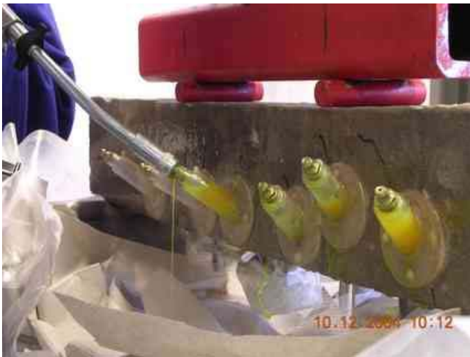
Verpressen der Risse