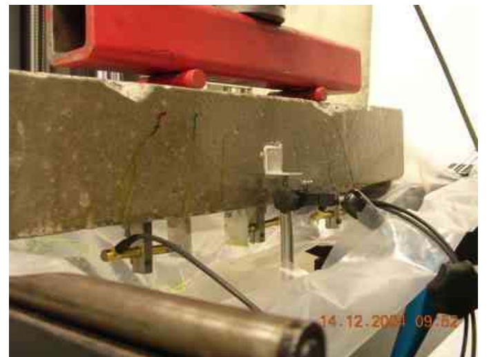
Prüfung unter Schwelllast während das Harz abbindet